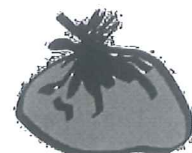
Dans les ordures ménagères