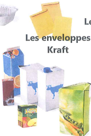
Les enveloppes Kraft