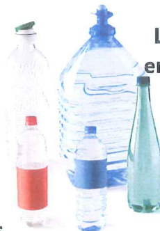
Les bouteilles et bidons en plastique transparents