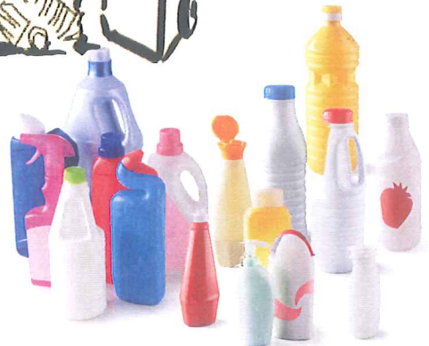
Les bidons et bouteilles en plastique opaques