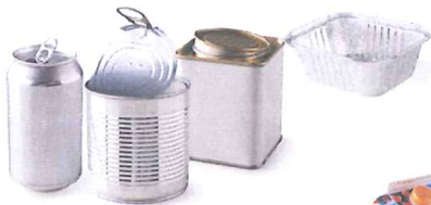
Les boîtes et barquettes en aluminium