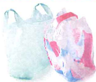
Les films et sacs plastiques

Je ne dépose pas dans ma caissette, mon sac ou mon bac jaune: