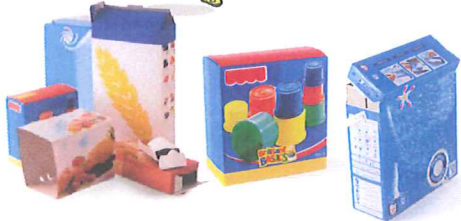
Les boîtes et suremballages en carton