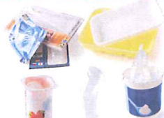
Les petits emballages plastiques ou en polystyrène