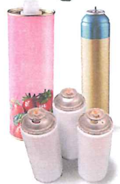
Les aérosols vides