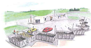
A la déchèterie